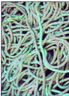
GRUPE JUGES 1

La complexité de l'institution pour les justiciables, et la complexité des problèmes juridiques et des situations auxquelles on est confronté. Le rapport au temps, le temps nécessaire pour trancher. Le temps qui n'est pas laissé au juge pour trancher. Notre rôle : il faut trancher, mais après avoir essayé de démêler les choses.