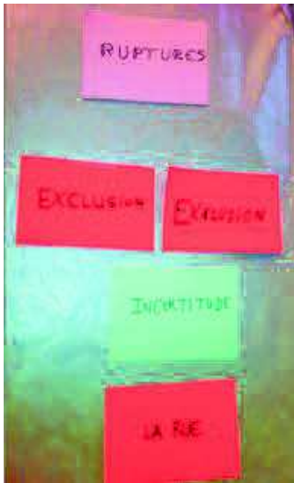
GRUPE JUGES 1