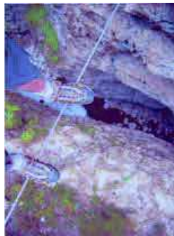
GRUPE JUGES 2

La justice, c'est trouver un équilibre Le risque pour le plus fragile est de tomber. La justice est que la personne passe le précipice. Pour traverser il faut être dynamique, en mouvement, être acteur Le juge rééquilibre ce qui n'est pas équilibré.